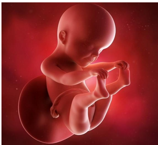
Embrione alla 28ª settimana di Gravidanza

Durante il secondo trimestre di gravidanza, che inizia dalla dodicesima settimana, si inizia a indagare la conformazione degli organi del feto. Saranno due gli esami ecografici, l'ecografia morfologica, volta alla valutazione dello stato di salute di tutti gli organi del feto, e un'ecografia pre-morfologica, in quanto si colloca anticipatamente all'ecografia pre-morfologica, avente lo scopo di anticipare questa indagine al momento di formazione degli organi. Come si può ben immaginare, questo è un periodo molto importante e delicato, di conseguenza lo specialista potrebbe ritenere opportuno, in accordo con la mamma, eseguire altri esami ecografici più specifici quali, a esempio, l'ecocardio fetale, consistente nello studio accurato del cuore del feto.