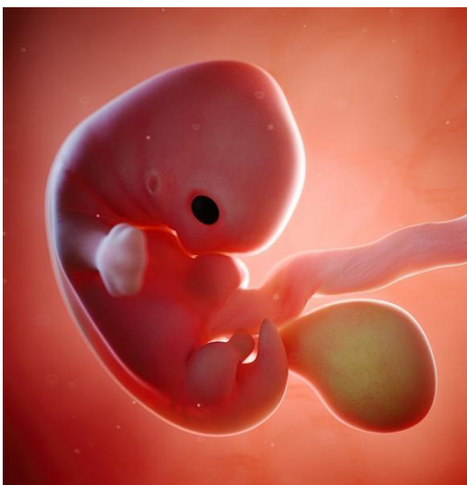
Embrione alla 7° settimana di Gravidanza

Il Test di Gravidanza è una prima indicazione su quello che potrebbe essere il Vostro stato di Maternità, ma non basta. Il primo esame da effettuare sono le Beta hCG (una frazione di un ormone che viene prodotto da un primo abbozzo di placenta quando l'embrione si annida nell'utero), le quali restituiscono dei valori iniziali più precisi per quanto riguarda lo status di Gravidanza. Nel caso in cui i valori dovessero essere positivi, inizia il Nostro percorso insieme, con un filo conduttore che ci legherà 24/24, saremo disponibili per voi per qualsiasi dubbio o urgenza, avrete a disposizione un numero di telefono a Voi dedicato acceso notte e giorno e la possibilità di venire alla Domus ogni volta che ne avrete bisogno.