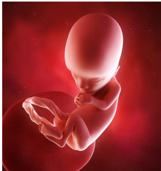
Embrione alla 13ª settimana di Gravidanza

La prima "vera" ecografia viene eseguita tra la decima e la tredicesima settimana di gravidanza, durante la quale i Nostri Ecografisti andranno a misurare lo spessore della "traslucenza nucale", un indice fondamentale anche per la diagnosi di alcune tra le più frequenti patologie neonatali. Verrà, inoltre, effettuata la flussimetria delle arterie uterine, al fine di valutare l'irrorazione sanguigna del feto. In questa sede, se si desidera, sarà possibile eseguire degli ulteriori test prenatali, tra cui il BI-Test, utile per valutare il rischio che il nascituro sia affetto da sindromi cromosomiche, specialmente da Sindrome di Down. Nel caso in cui vogliano eseguirsi altri accertamenti, come i test genetici eseguiti sul DNA fetale, questi potranno essere elaborati con un semplice prelievo di sangue, ma si dovrà tornare nelle settimane successive.